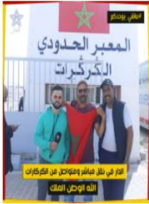
أمر في ظل هياكل ومنازل من الكمرات الله الوطن الملك

الرئيسية / سلايدر / الملتقى الدولي للتمر بالمغرب 2023.. تنظيم منتدى الاستثمار للنهوض بسلسلة التمور