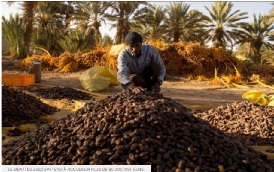
LE SIDATTES 2023 S'ATTEND À ACCUEILLIR PLUS DE 90 000 VISITEURS.