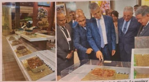
La production prévisionnelle devrait atteindre 7.300 tonnes dans l'oasis de Figuig. La province dispose d'une capacité de stockage avoisinant les 1.680 tonnes/an

L'INAUGURATION d'un forum dédié à l'exploration de l'investissement dans la filière phoenicicole, en tant que moteur du développement de la productivité et de la durabilité des oasis», constitue une remarquable tribune dédiée à l'épanouissement des horizons de la culture du palmier dattier. C'est, de surcroît, une opportunité offerte aux experts ainsi qu'aux entrepreneurs, pour dévoiler leurs concepts novateurs visant à augmenter les rendements, à stimuler la productivité, et à enrichir les revenus générés par cette filière. Un partage de connaissances qui s'avère incontournable dans la quête de préserver cette filière face aux vicissitudes du changement climatique, aux menaces micro-organiques, à savoir les virus, les bactéries, et les champignons, et aux pratiques d'exploitation inconsidérées.