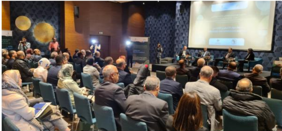
L'agrégation agricole s'invite à un séminaire à Casablanca

Le 30 novembre à Casablanca, l'Agence pour le développement agricole (ADA) a organisé, en collaboration avec la Direction régionale de l'agriculture de Casablanca-Settat, un séminaire sur l'agrégation agricole dans le cadre du Projet d'appui au Programme national d'économie d'eau d'irrigation (PAPNEEI-2), financé par la Banque africaine de développement (BAD), dans les périmètres irrigués du Loukkos et des Doukkala.