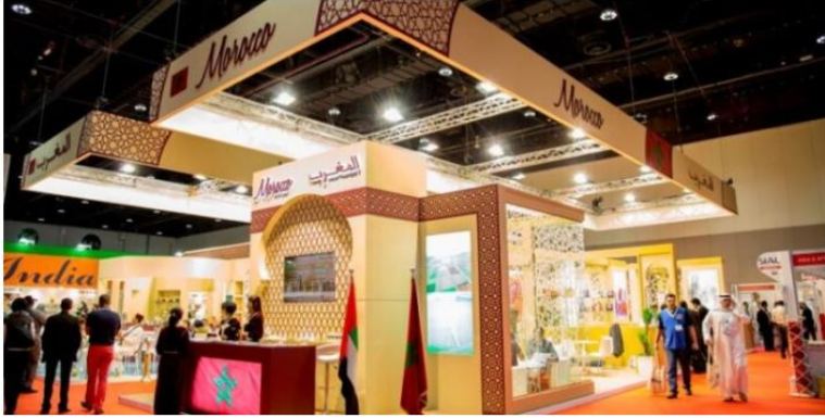
إنطلاق فعاليات معرض أبوظبي الدولي للأغذية بمشاركة المغرب