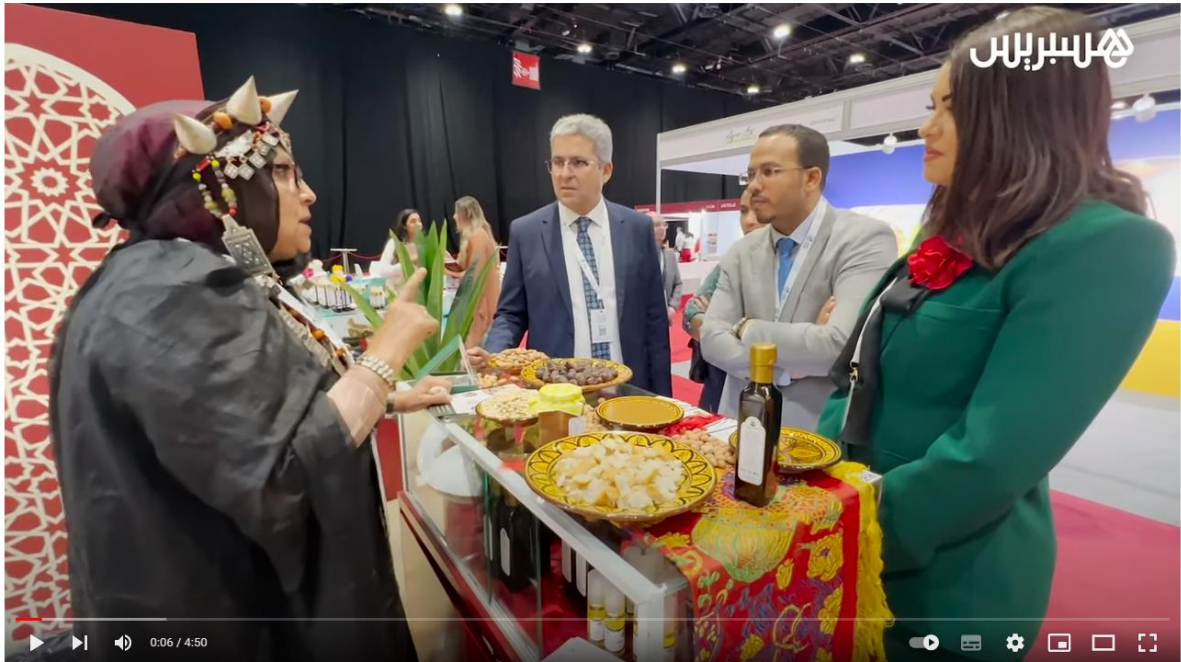
تعاونيات مغربية تتميز في معرض أبوظبي للأغذية