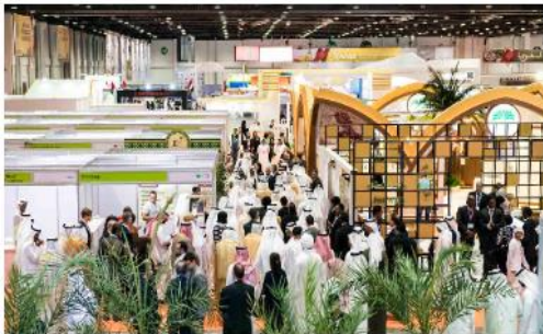
06/12/2022 13:30