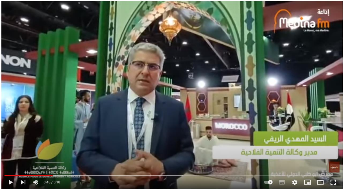
المنتجات المحلية المغربية تتألق من جديد في الساحة الدولية